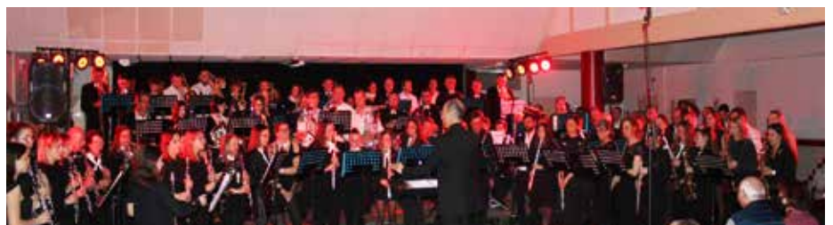
Une centaine de musiciens, l'harmonie vincentienne et l'harmonie de Rion des Landes, 2 beaux programmes, 2 morceaux en commun, voilà le secret de la réussite du concert de printemps !