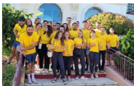
Très classe !