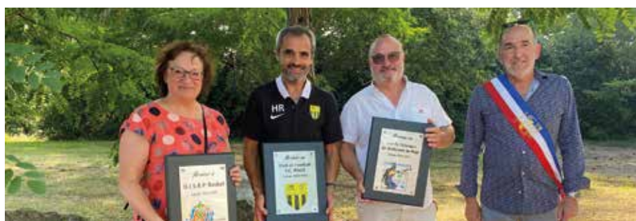
Honorés le 14 juillet.

➤ Le premier bal des Boogie Boots country le 15 octobre s'est déroulé dans la joie et la bonne humeur avec beaucoup de partage et de convivialité .