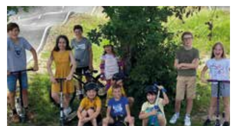
Visite de skateparks et pumtracks.