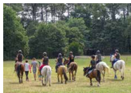
Centre équestre les Balzanes.