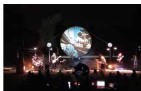
Le Jour de la nuit : concert T6o.