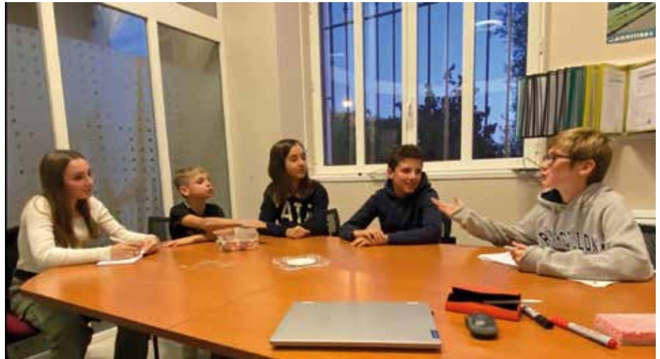
Rédaction d'articles en groupe.

Mais puisque l'idée première d'un Conseil municipal de Jeunes, c'est de leur donner la parole, continue l'adjointe, je leur laisse la place."