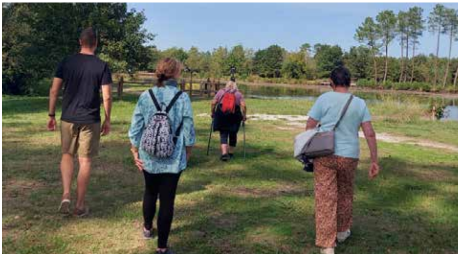
17 personnes ont participé à la marche autour de l'étang de la Glacière.

La "Semaine bleue" destinée à valoriser les aînés a été organisée pour la première fois sur la commune. Un vrai succès venu compléter les plus traditionnelles participation à la collecte de la Banque alimentaire et distribution des colis de Noël.