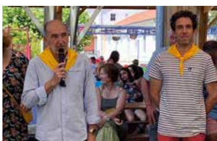
Jour de fête au Comité.