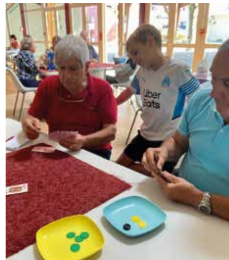
Un très bel échange intergénérationnel.

• Vendredi 7 octobre, deux cabinets de kinésithérapie de la commune ont suggéré des exercices d'assouplissement et d'étirement avant une marche qui s'est