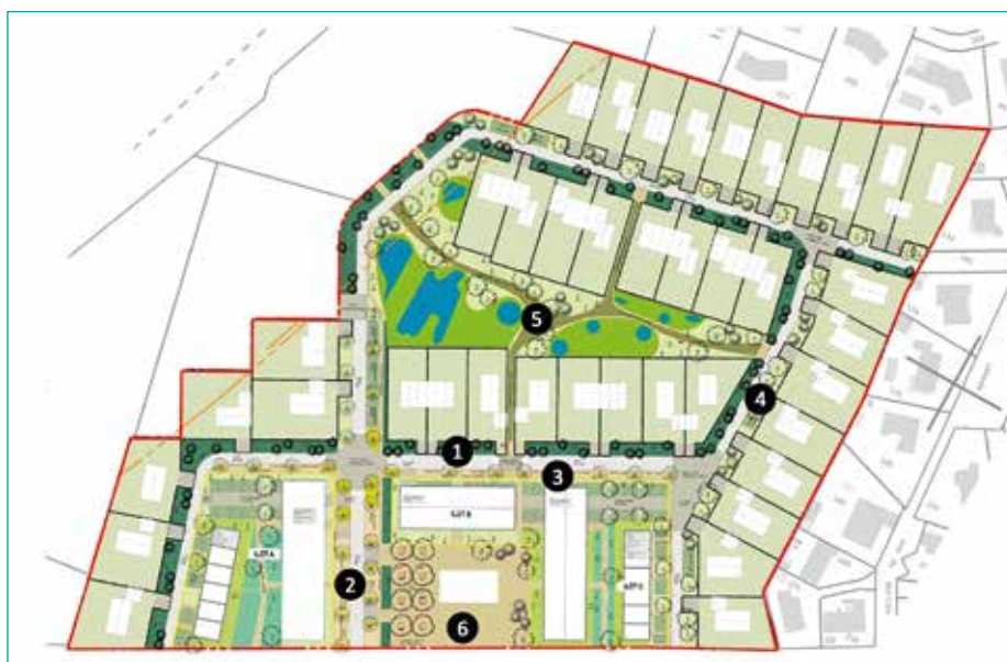
Plan de masse (17 % d'espaces publics en pleine terre végétalisée).

Prix : entre 145 et 150 euros TTC le m 2 . Soit pour un terrain de 550 m 2 : entre 79 750 et 82 500 euros TTC. S'adresser à la Satel : 05 58 91 20 90.