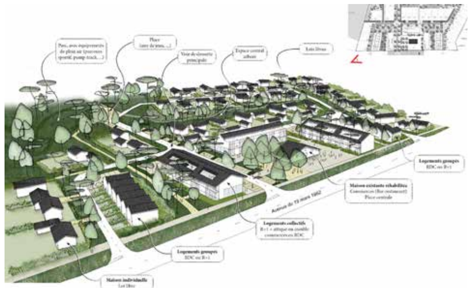
Vue du projet de quartier depuis l'avenue du 19 mars 1962

Le projet sur cinq hectares est le fruit d'une volonté de mixité sociale, de diversité des logements et de qualité des espaces publics. Il comprendra des maisons individuelles en lots libres (80%), des maisons en bande, de petits immeubles avec un étage, des locaux