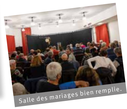
Salle des mariages bien remplie.