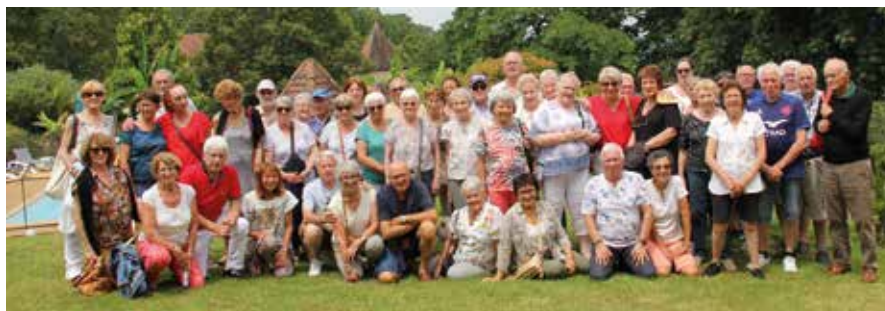
Escapade en Périgord en juin 2024