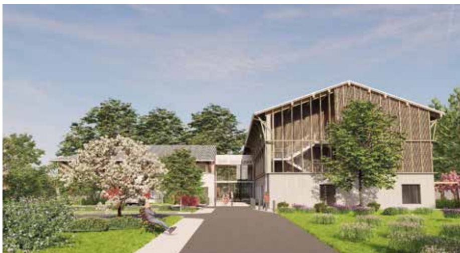
Le projet en deux bâtiments respectant les codes urbanistiques locaux.

Jusqu'en 2017, l'établissement a consolidé sa reconnaissance dans un territoire dominé par le public. Privé à but non lucratif, il est aujourd'hui