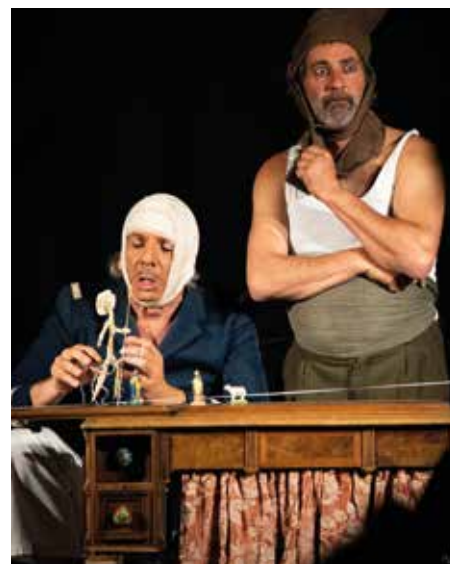
2 : Don Quichote - théâtre d'objets